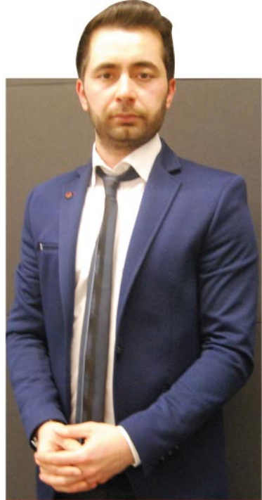
(Öğretmenim Dergisi / Özel Haber-İstanbul)

3-4 yıldır bu tarz işlerle muhatap oluyoruz. Örnek vermek 22 OĞARTMENİM DERGİSİ | NİSAN