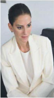
Paylaşma, açık fikre, açık bilgiye çok inanıyorum. Bu yeni Dünya zaten böyle.

Eğitimin uygulama kısmı paha biçilmez. Artık öğrenim uygulamadan geçiyor. Akademik olarak da kuvvetli bir altyapı verdiğinizde mezunlarımızın Türkiye'nin gelecekte liderleri olacağına inancımız tam.. Kurumsal partnerlerimiz var, sürdürülebilirlik kapsamında biz onlarla çalışıyoruz. Bu yeni devirde eğer özel sektörle birlikte ilerleyemiyorsanız ne teknolojiyi ne sektörün ihtiyaçlarını anlamaya imkânınız olmayacak.