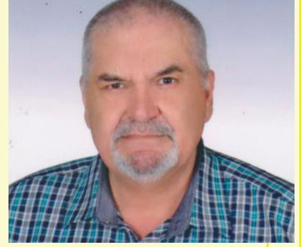
ADNAN GÜNDÜZ İmtiyaz Sahibi ve Sorumlu Yazı İşleri Müdürü

Ağustos ayı yaz sıcaklarının en yoğun olduğu aylardan biri olma özelliğini bu kez ekonomik savaşta en sıcak ay olarak göstermekte.