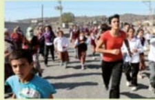
Köylüler öğretmenlerine sahip çıkmak için koşuyor...

Olayı öğrenciler şöyle anlattı: "Öğretmenlerimiz yemek yiyordu. Benden evden tuz istemişlerdi getirdim. Dönüşümde öğretmenler toplanmıştı. 'Kürt köktenli ve bayan öğretmenler burada kalsın, Türk öğretmenler bizimle gelecek' dediler. Altı öğretmenimizi alıp götürdüler. Annemle eniştem yollarını kesti, 'Sizin gibi Kürtler olmaz olsun' dediler. Teröristler annemle, eniştemi iteledi ve yürümeye devam ettiler. Biz de ağlamaya başladık. Öğretmenlerimizi geri döndü, derslerimize devam ediyoruz ve çok mutluyuz" diye konuşular.