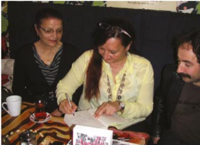
Annelik Ömür Boyu kitabını imzalatanlar arasında erkeklerin de olduğu dikkatimizi çekti...

"Eğer kadınlar ekonomiye daha fazla katılırsa ülke kendi geleceğini daha etkin ve daha güçlü biçimde belirler. Çünkü kadın çok iyi bir üretim gücüdür. Kadının elinin değdiği her şey daha güzelleşir. Kadınlar ülkemizin ve dünyamızın geleceğinin şekillendirilmesi konusunda daha etkin hale gelmelidir. Kadınlar hem anne olabilir hem de kariyer sahibi olabilirler. Kitabımda yer verdiğim 60 kadın bunun en güzel ve en çarpıcı örneklerini oluşturuyor. Bunun için de kadınlara hayatın her alanında pozitif ayrımcılık yapılmalıdır."