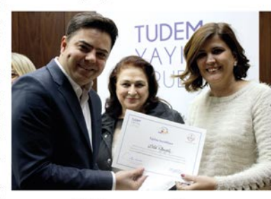
YENİ EĞİTİM PROGRAMLARI İÇİN ÇALIŞMALAR BAŞLATILDI

Yazarlar ve öğretmenler arasındaki iletişimin devam ettirilmesi amacıyla Facebook ortamında <u>İSTMEM-TUDEM OKU-</u> MA <u>KÜLTÜĞÜ</u> adıyla bir grup kuruldu. 18 aatlık eğitimin bir uzantısı olarak da değerlendirilebilecek bu interaktif platform üzerinden fikir, bilgi ve deneyim paylaşımının süreklilik kazanmasının hedeflendiği vurgulanı